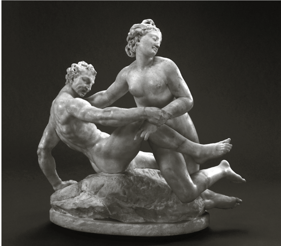
Italien, 18. Jahrhundert, SATYR UND NYMPHE. Marmor. Erworben 1965. Skulpturensammlung. Inv. 24/65 / Raum 134